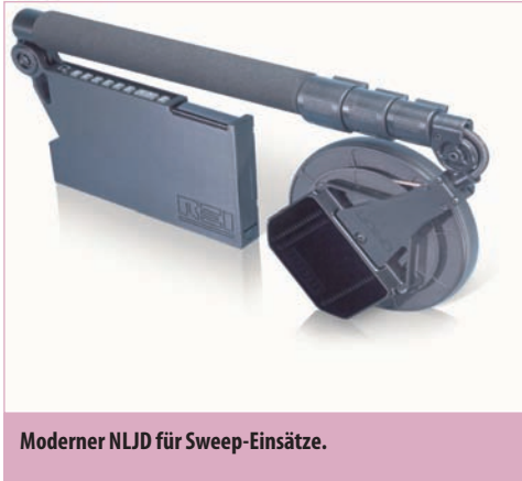
Moderner NLJD für Sweep-Einsätze.

aufwendigen Messinstrumenten sehr gut hinter harmlosen Sendern (Radiostationen, Betriebsfunk etc.) verstecken.